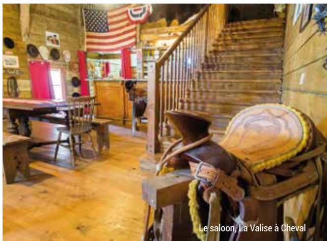
Le saloon, La Valise à Cheval