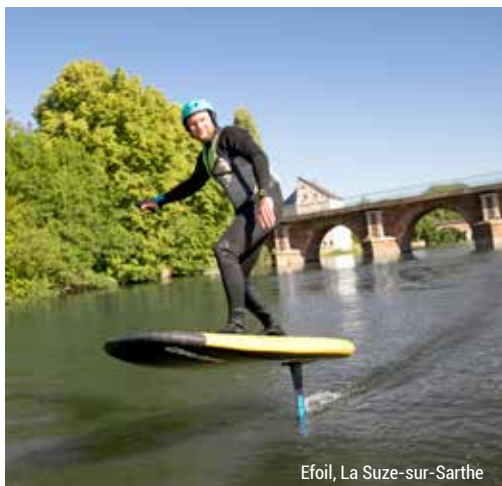
Efoil, La Suze-sur-Sarthe