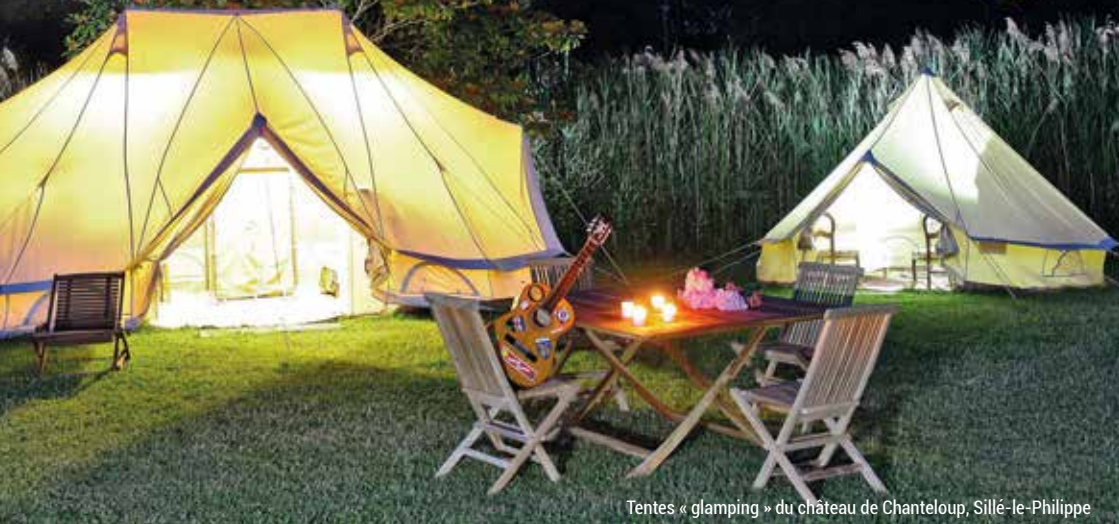
Tentes « glamping » du château de Chanteloup, Sillé-le-Philippe

Envie de dépaysement ? Découvrez quelques idées de séjours insolites proches de chez vous !