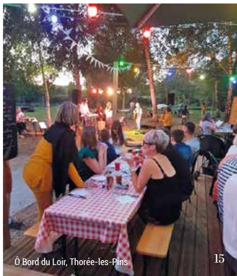
Ô Bord du Loir, Thorée-les-Pins