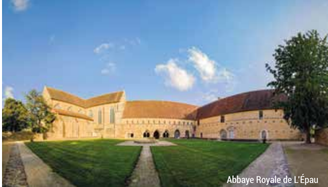
Abbaye Royale de L'Épau