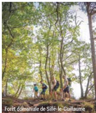
Forêt domaniale de Sillé-le-Guillaume

www.sarhetourisme.com/itineraires-pedestres