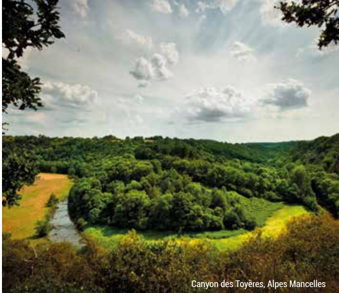
Canyon des Toyères, Alpes Mancelles

Le Parc Naturel Régional Normandie-Maine, dont font partie les Alpes Mancelles, est candidat au label Géoparc mondial UNESCO avec comme points forts ses pierriers exceptionnels.