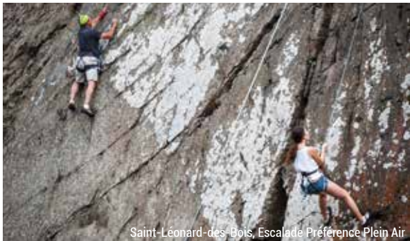
Saint-Léonard-des-Bois, Escalade Préférence Plein Air

Les sites du Saut du Cerf et de Rochebrune offrent un point de vue culminant et un panorama exceptionnel sur la forêt domaniale et le bocage de Sillé-le-Guillaume. Deux autres sites d'escalade sont à découvrir au Domaine du Gasseau à Saint-Léonard-des-Bois et à Louzes.