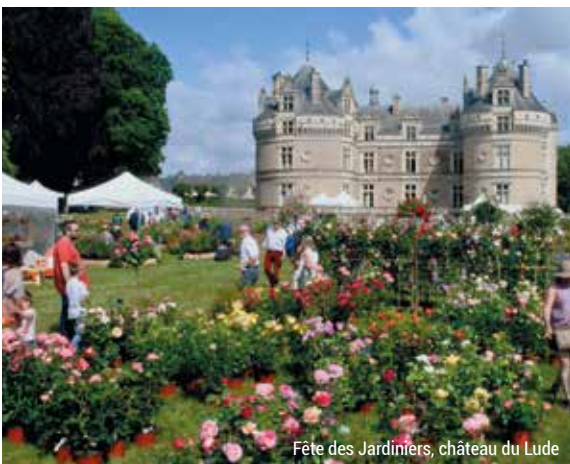
Fête des Jardiniers, château du Lude