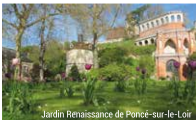
Jardin Renaissance de Poncé-sur-le-Loir