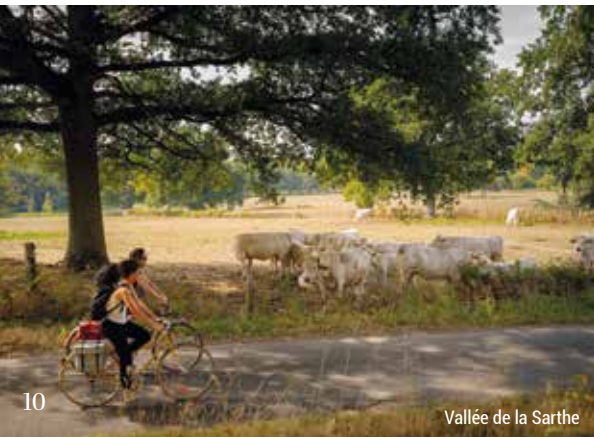
Vallée de la Sarthe