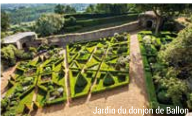
Jardin du donjon de Ballon