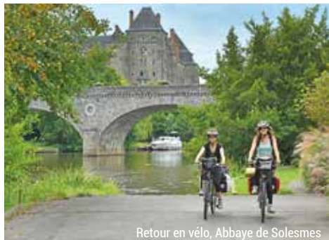
Retour en vélo, Abbaye de Solesmes