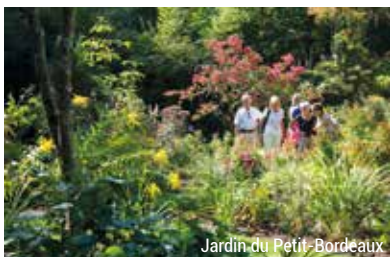
Jardin du Petit-Bordeaux

Flânez dans les sept jardins remarquables de la Sarthe et vivez une parenthèse bucolique et poétique : le prieuré de Vauboïn (1 er prix de l'Art du Jardin 2020), les jardins du donjon de Ballon, le jardin du Petit-Bordeaux, le jardin du château du Lude, le jardin du château de Villaines, le jardin du château du Mirail et le jardin Renaissance de Poncé-sur-le-Loir.