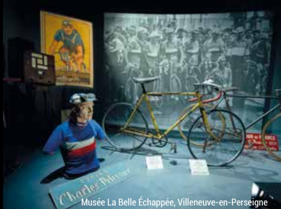
Musée La Belle Échappée, Villeneuve-en-Perseigne

Retrouvez l'ensemble des musées sur : www.sarthe tourisme.com/culture