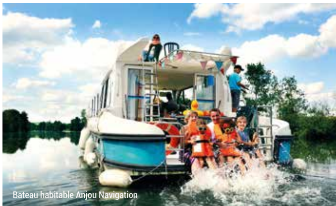
Bateau habitable Anjou Navigation