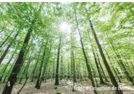
Forêt d'Exception de Bercé

Dans le département, 17 sites sont classés « Espaces Naturels Sensibles » et 12 sites Natura 2000. De nombreuses animations sont proposées toute l'année pour découvrir la faune et la flore dans le respect de la nature. www.sarthetourisme.com/la-sarthe-si-proche-si-nature