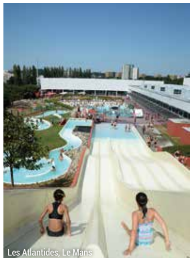
Les Atlantides, Le Mans