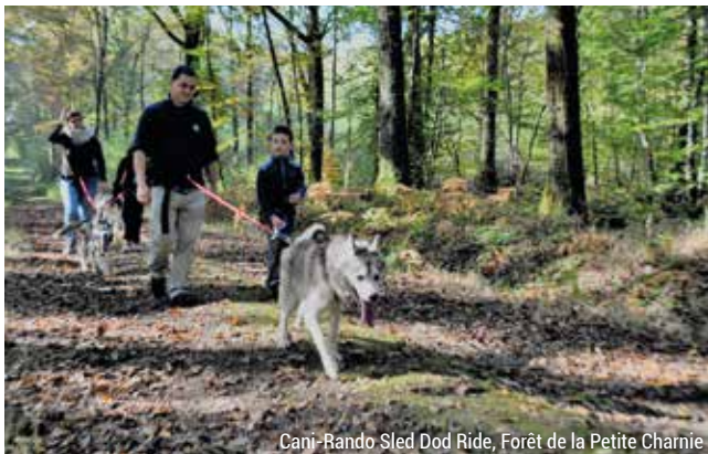
Canis-Rando Sled Dog Ride, Forêt de la Petite Charnie

www.sleddogride.fr www.lescrocsblancssarthois.fr