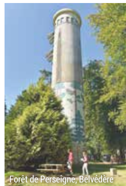
Forêt de Perseigne, Belvédère