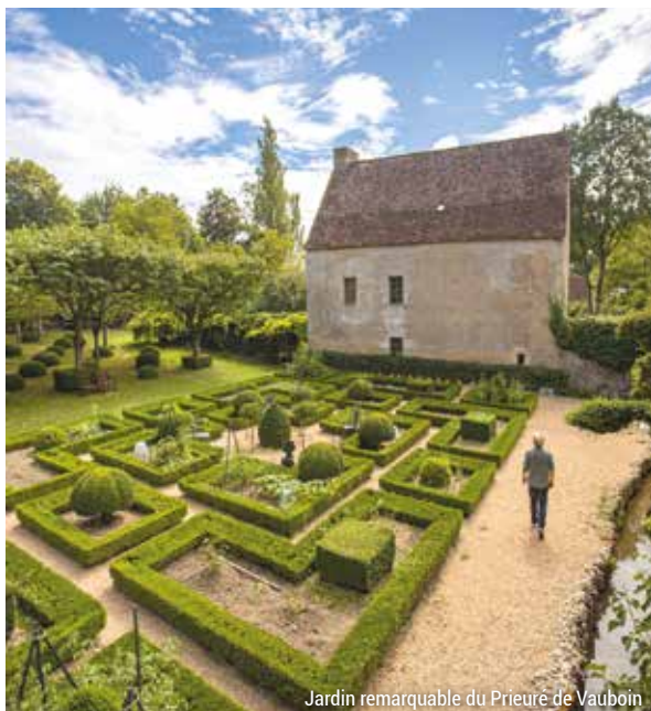
Jardin remarquable du Prieuré de Vauboïn

Retrouvez l'ensemble des jardins sur : www.sarthetourisme.com/voyage-poetique-au-coeur-des-jardins