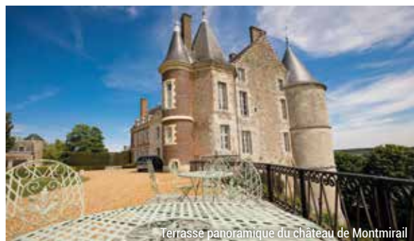
Terrasse panoramique du château de Montmirail