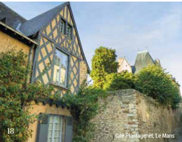
Cité Plantagenêt, Le Mans