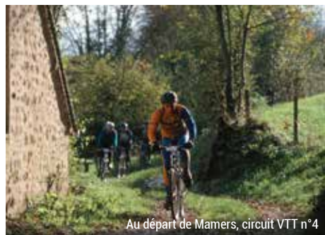
Au départ de Mamers, circuit VTT n°4