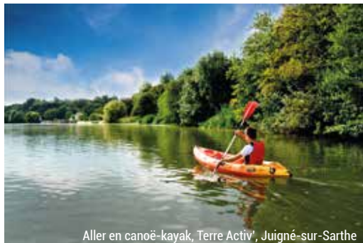
Aller en canoë-kayak, Terre Activ', Juigné-sur-Sarthe