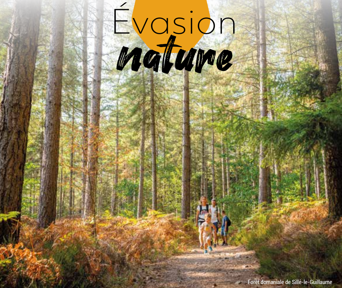
Forêt domaniale de Sillé-le-Guillaume

Forêts, bocages, rivières et petites montagnes façonnent le paysage sarthois. Cette diversité est une promesse d'évasion et de dépaysement faite à tous les passionnés de nature.