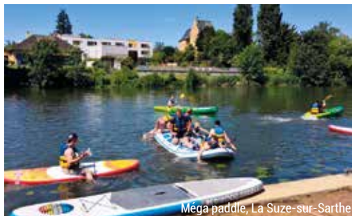
Méga paddle, La Suze-sur-Sarthe

Et si vous marchiez (ou presque) sur l'eau ? Choisissez un paddle en solo pour observer la rivière sous un nouvel angle. Si vous êtes adepte de bonnes parties de rire, à vous le paddle géant de La Suze-sur-Sarthe, c'est l'embarcation ludique par excellence. Entre 8 et 10 personnes peuvent s'y tenir debout !