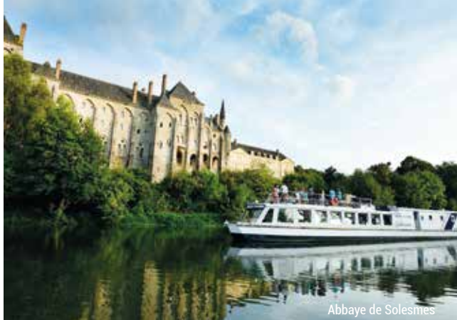
Abbaye de Solesmes